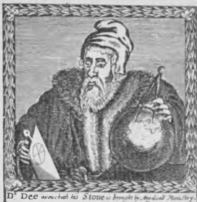
Dr Jan Dee

Aby pozbyć się Kelley'a, zamierzał Dee użyć własnego syna, Artura, jako medjum i odbył z nim trzy seansy; Artur widział wprawdzie w kryształach „starca białobrodego i nieczytelne listy“, ale żaden duch przez jego usta nie przemawiał. Gdy jednak w ostatnim seansie wziął udział Kelley, od razu przemówił przezeń duch Uriel. Następnego dnia przejawiała się przez usta Kelley'a dziewczynka Madini, jego stały duch kontrolny i poleciała im, aby „wspólnie swych żon używali“. Na wahania i wątpliwości dał Kelley na piśmie Dee'emu uroczyste potwierdzenie, że „taka jest rzeczywiście wola Boga“, a zrozpaczyony Dee oświadczył tę „wolę“ swej żonie i zaniechał oporu przeciw Kelley'owi.