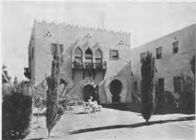
Muzeum orientalne w ośrodku R + C w San Jose.

Ze względu na niezwykle rozwój tej organizacji oraz jej niewątpliwe związki z prawdziwymi różokrzyżowcami, nie od rzeczy będzie zapoznać się bliżej z jej organizacją i metodami pracy. Centrala Zakonu znajduje się w mieście San Jose, gdzie w rozległym parku zwanym „Rosicrucian Parc” mieści się ogromny kompleks budynków. Obejmują one bogate biblioteki, archiwa, ciekawe muzeum, wspaniałe planetarium, laboratorium, świątynię i t. p., oraz piękny budynek Uniwersytetu Rose Croix. Wszystkie budynki utrzymane są w stylu egipskim. Organizacja wydaje dwa miesięczniki: „ The Rosicrucian ”