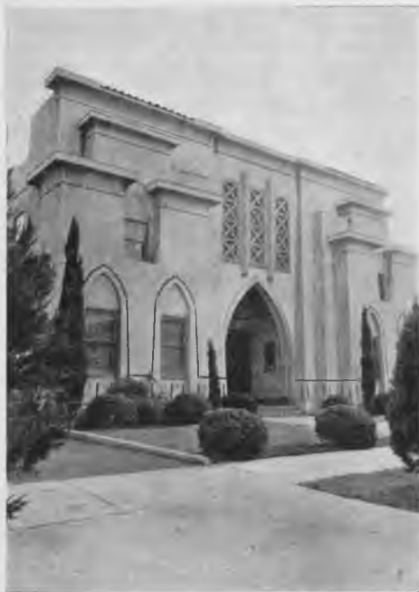
Główne audytorjum ośrodka R + C w San Jose.