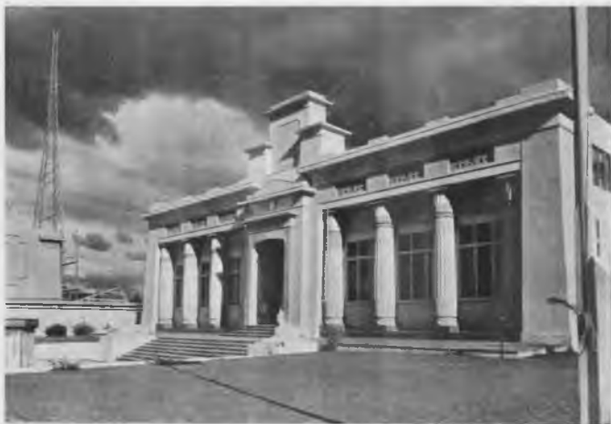
Wejście do gmachu Uniwersytetu Rose + Croix w San Jose.