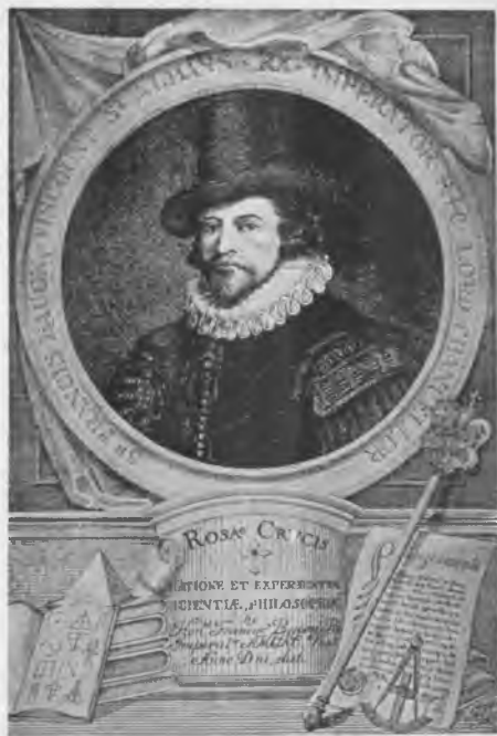
Sir Francis Bacon Imperator Różokrzyżowców.

(Do artykułu w „Lotosie” rocznik IV, str. 251)