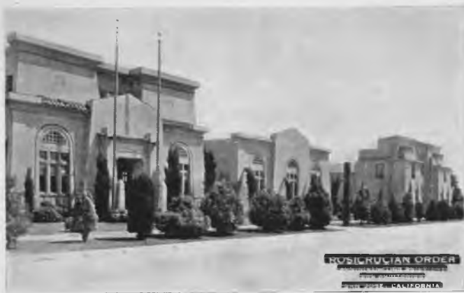
Budynki administracyjne i główne audytorjum ośrodka R + C w San Jose.

Z dalszych publikacji „FUDOSI” i wydawnictw poszczególnych organizacji, jakie w skład jej wchodzi, można dojść do wniosku, że wiele z nich stanowi „koło zewnętrzne”, osłaniając wewnętrzną komórkę różokrzyżową. Organizacje te jakby były „przedśmionkiem świątyni”, przez który przejść musi każdy, szukający bram prawdziwego Zakonu Róży Krzyża. Jest to więc filtr odrzucający niepożądane jednostki i szkoła przygotowująca do dalszego istotnego wtajemniczenia. Różnorodność tych organizacji wpływa z konieczności dostosowania nauk okresu przygotowawczego do odrębnych typów psychicznych, zgłaszających się kandydatów. Takimi szkołami zewnętrznymi są niewątpliwie: „Ordre Hermetiste”, „Ordre Martiniste”, „Ordre Kabbalistique de la