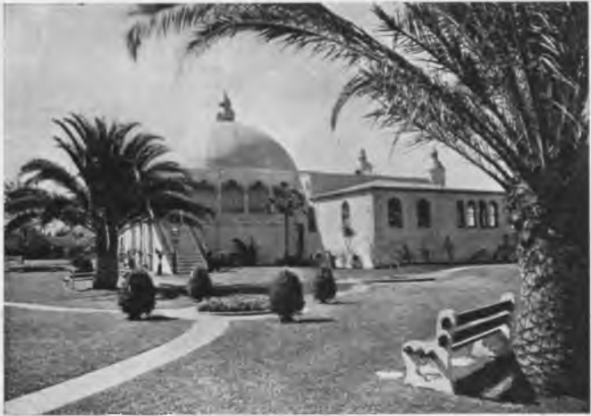
Planetarium w ośrodku R + C w San Jose.